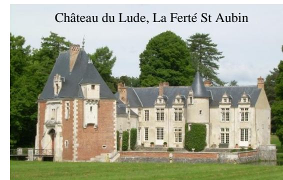
Château du Lude, La Ferté St Aubin